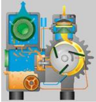
Рис.1 Принцип работы пластинчато-роторного вакуумного насоса с рециркуляционной смазкой

одно- или двухступенчатого маслозаливного пластинчато-роторного вакуумного насоса вам не обойтись. Сухие же пластинчато-роторные вакуумные насосы и компрессоры лучше всего использовать там, где нужны невысокие (150 мбар для вакуума и до 2 атм изб. для компрессора), но экологически чистые вакуум и давление.